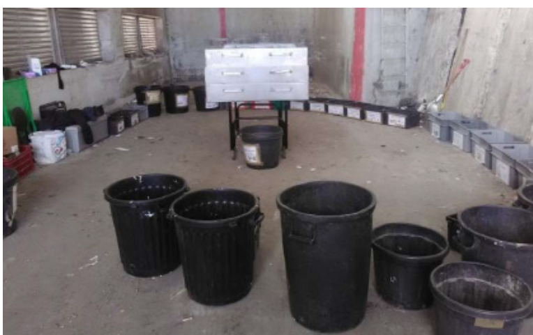
Tri de la fraction > 100 mm