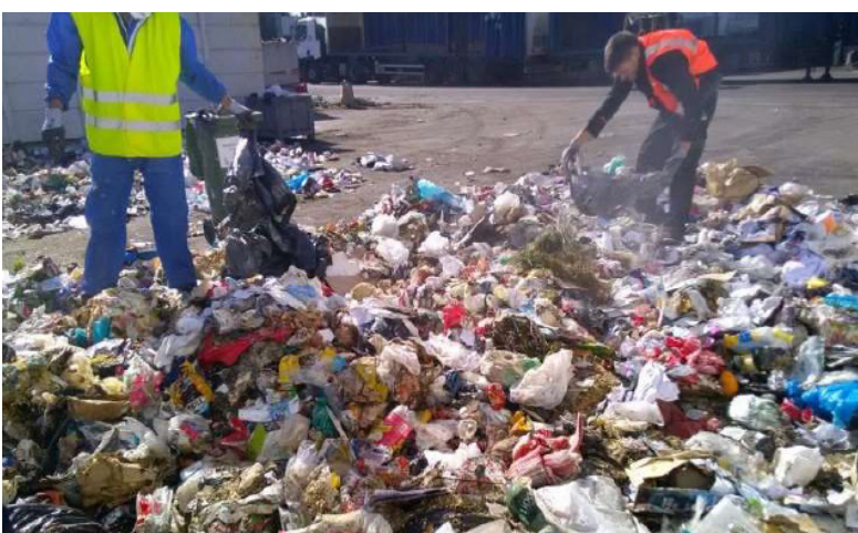
Ouverture des sacs