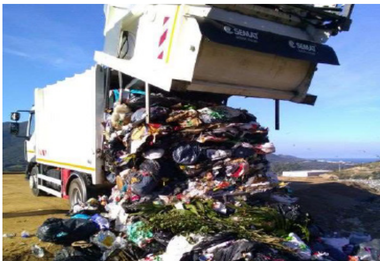
Dépotage d'une benne d'OMr