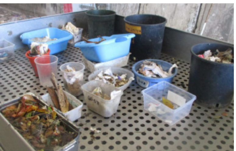
Tri des moyens (20-100 mm)