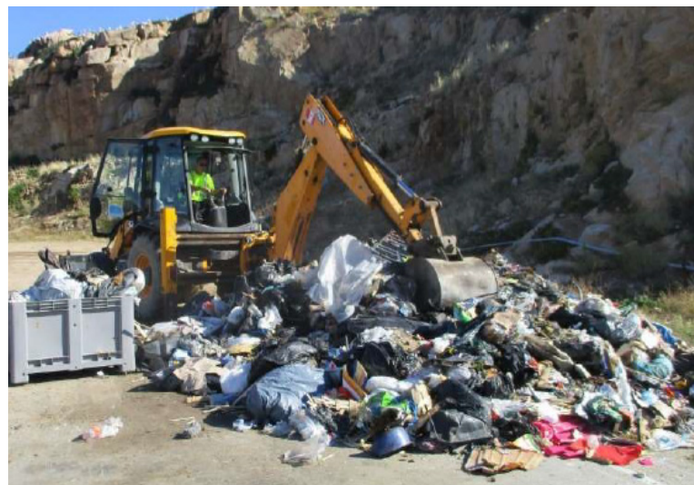
Prélèvement de l'échantillon